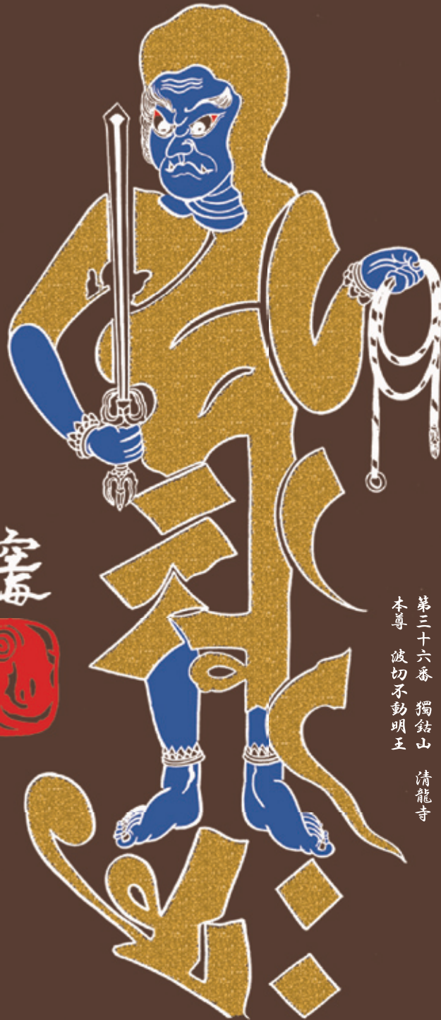
第三十六番 獨鈷山 清龍寺 本尊 波切不動明王